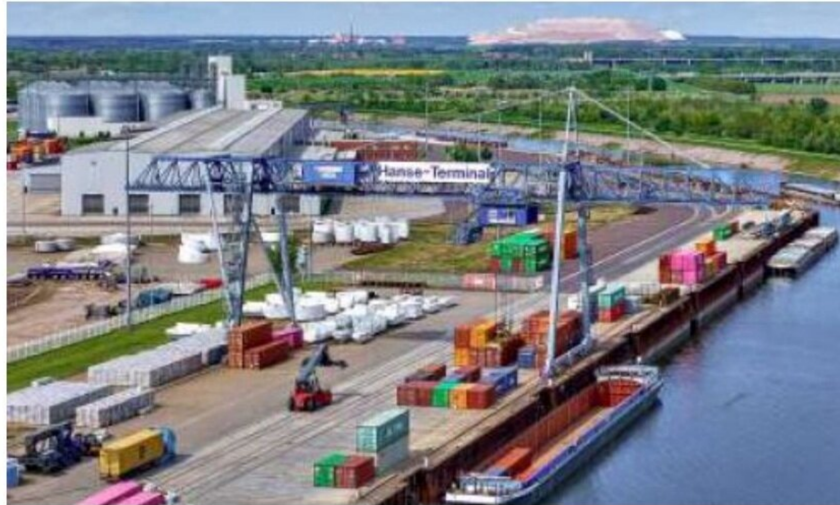
Blick auf den Magdeburger Hafen. Er erwirtschaftet Gewinne, die Stadt wollte sich die Option offenhalten, diese abziehen zu können.

Die Gewinne der zurückliegenden Jahre variieren. Der aktuellste Jahresabschluss (2024) zeigt einen Überschuss von rund 818.000 Euro. Im Jahr zuvor lag er bei 1,46 Millionen Euro – der höchste in den vergangenen sieben Jahren.