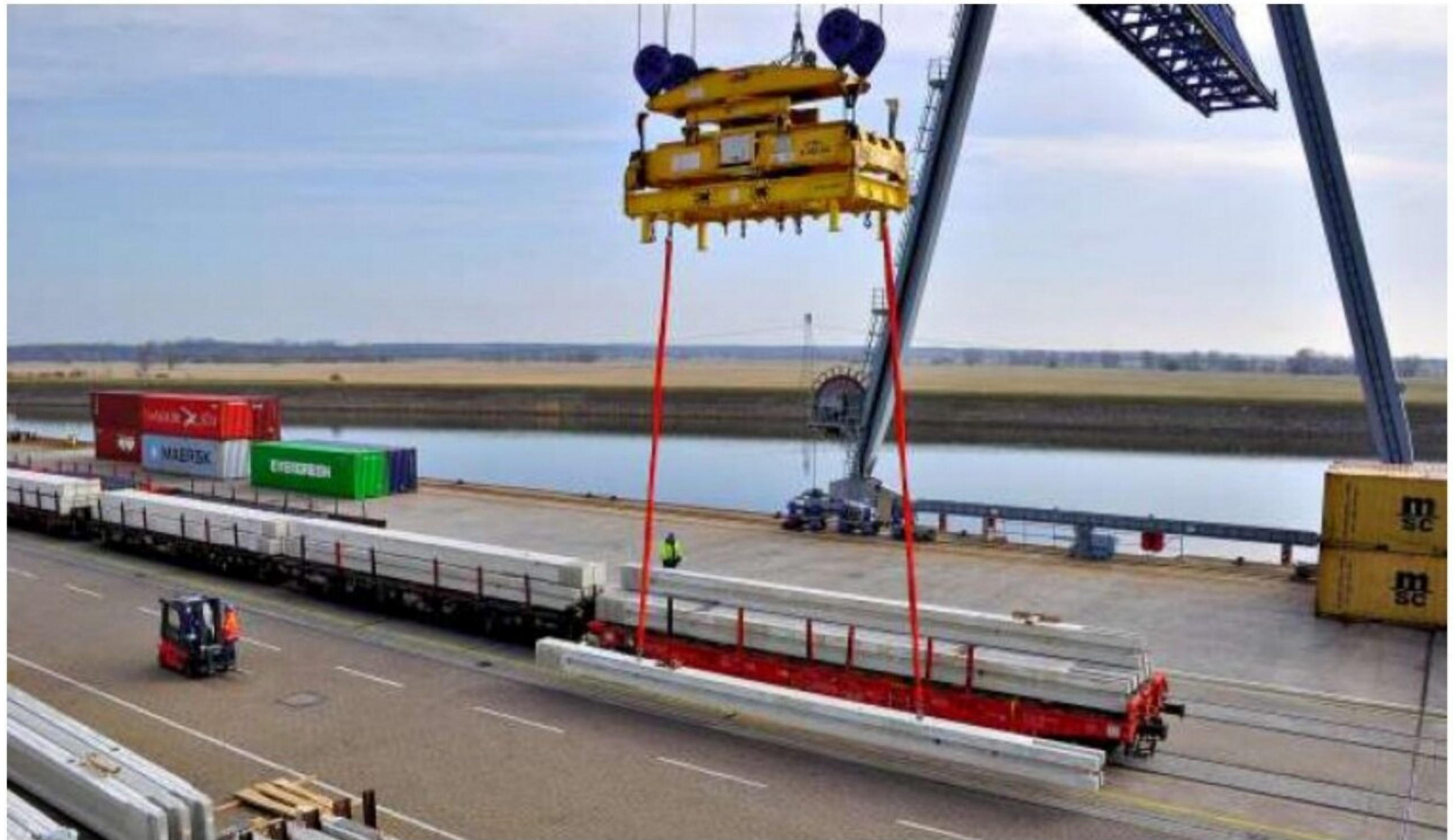
Blick in den Magdeburger Hafen: Tonnenschwere Güter werden hier zum Weitertransport umgeschlagen.

Auch über das Kerngeschäft hinaus ist die Magdeburger Hafen Gesellschaft in der Stadt präsent. Das Engagement für Magdeburg sei vielfältig: „Sport, Kultur und die Unterstützung sozialer Belange sind dabei unsere drei wesentlichen Kriterien“, sagt der Hafen-